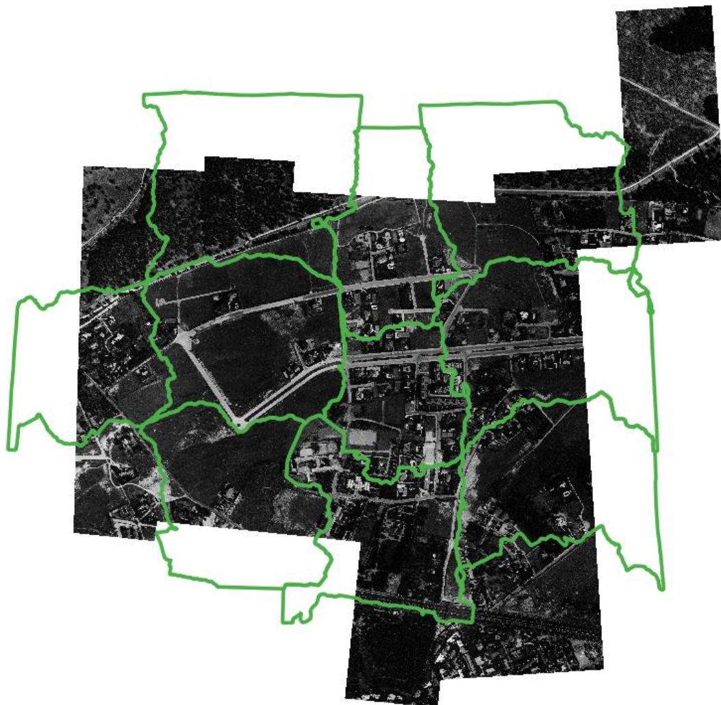
Fotogramas dentro tolerancia (verde)

FCC_AD_shp_1995.shp: En este SHP se informa de los fotogramas a los cuales les garantizamos la precisión planimétrica. Para este vuelo de 1995, en el 98% de los casos, el error planimétrico debe ser inferior a los 1.5 metros.