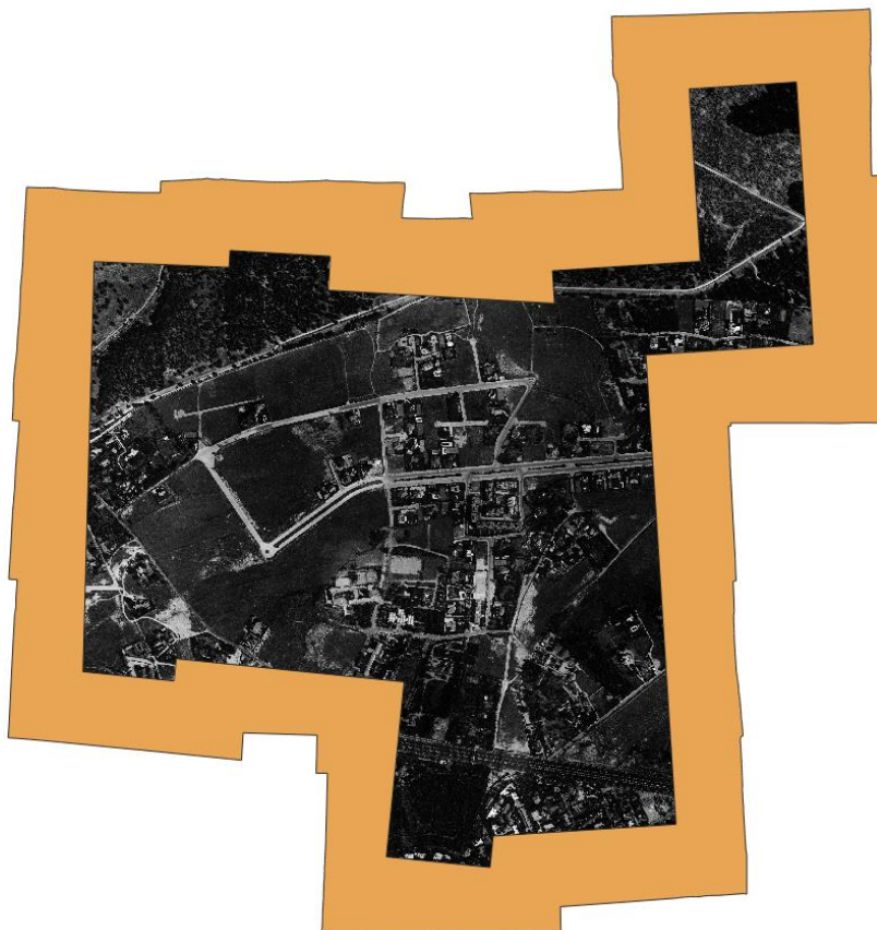
Ámbitos de exclusión en color marrón.

ACC_AE_shp_1995.shp : En este SHP está el ámbito de exclusión de control de calidad por falta de vuelo.